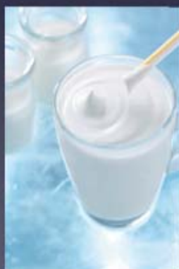
ヨーグルトシェイク